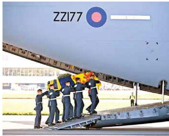
Una aeronave C-17 Globemaster trasladó el féretro, que todo el tiempo mantuvo sobre él la corona con flores blancas.