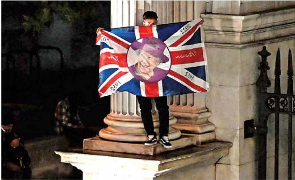
Un hombre mostró una bandera de Reino Unido con el rostro de la monarca en un círculo en el centro de la tela.