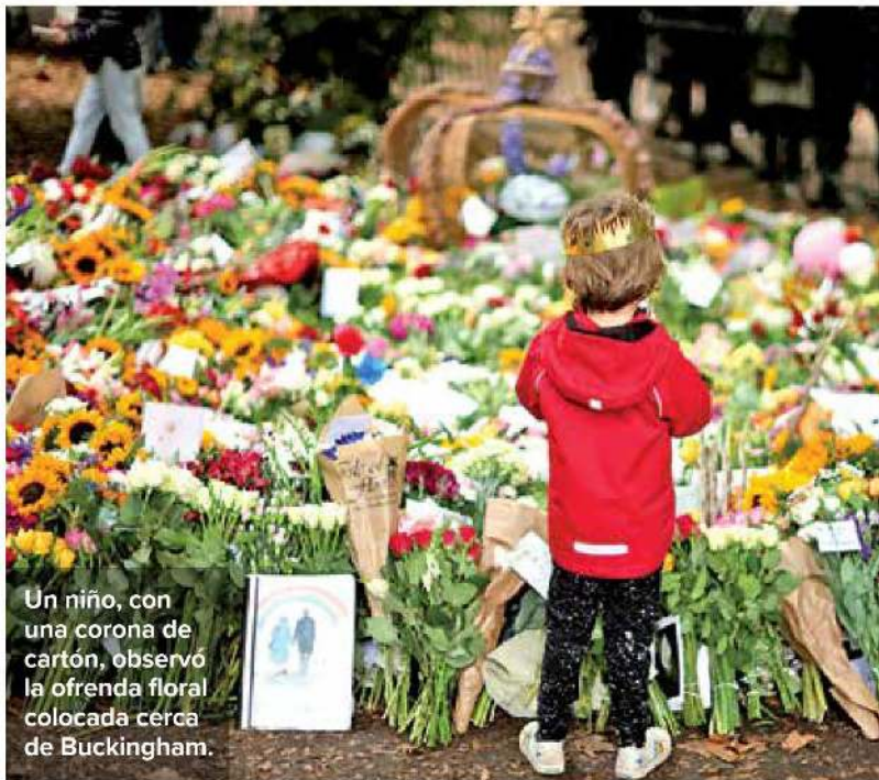
Un niño, con una corona de cartón, observó la ofrenda floral colocada cerca de Buckingham.