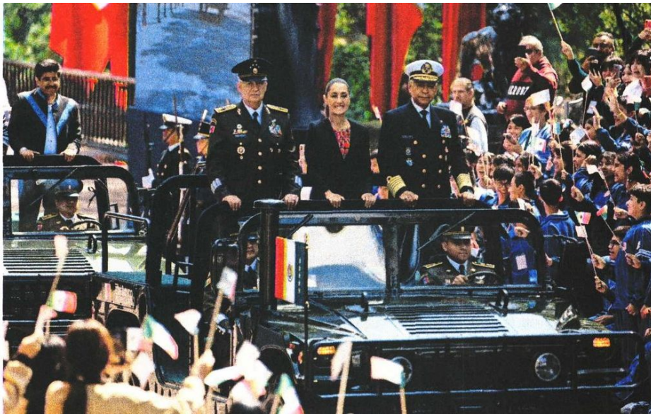
El pasado 16 de septiembre, el secretario de Marina, Raymundo Pedro Morales, reconoció públicamente el contrabando de combustible en el que están involucrados militares.