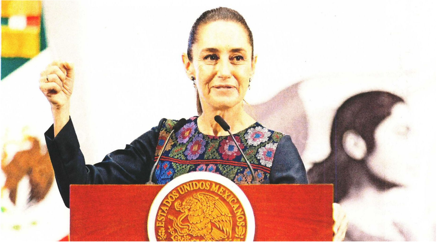
La presidenta Claudia Sheinbaum calificó como hazaña de la 4T que 13.4 millones de mexicanos lograran salir de la pobreza, lo que es prueba de la eficacia de su gestión.