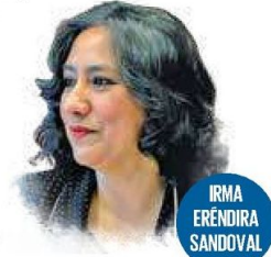
IRMA ERÉNDIRA SANDOVAL

sido simulado. Por ello, obra en el expediente el oficio 18/CFE/AQUI/0002/2020, mediante el cual la Secretaría de la Función Pública, cuando su titular era Irma Eréndira Sandoval , ordenó a la Dirección Corporativa de Ingeniería y Proyectos de Infraestructura verificar físicamente si los equipos fueron realmente entregados.