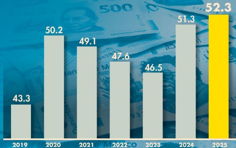
Saldo histórico de los requerimientos financieros del Sector Público | COMO PORCENTAJE DEL PIB, ESTIMACIÓN DE AGOSTO DEL 2025

El saldo de los requerimientos financieros del Sector Público alcanzó un 52.3% del PIB en agosto de este año, según la Secretaría de Hacienda, reflejando un aumento sostenido desde 2023; superó el 51.3% del 2024.