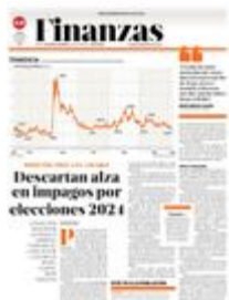
Gráfico: Rodolfo Gómez García