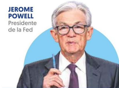
JEROME POWELL Presidente de la Fed

“La inflación ha empezado a subir. Puede que haya un retraso en su progreso en el transcurso del año”