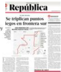
Gráfico: Daniel Rey