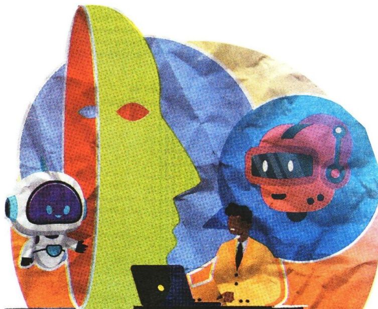
- Falacias. El chatbot detectó afirmaciones engañosas acerca de temas como la militarización.