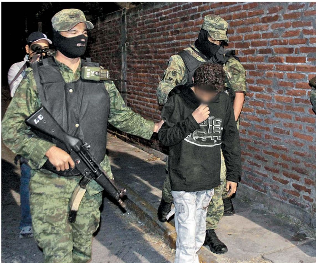
Dos infantes detenidos por federales por su presunta responsabilidad en homicidios.