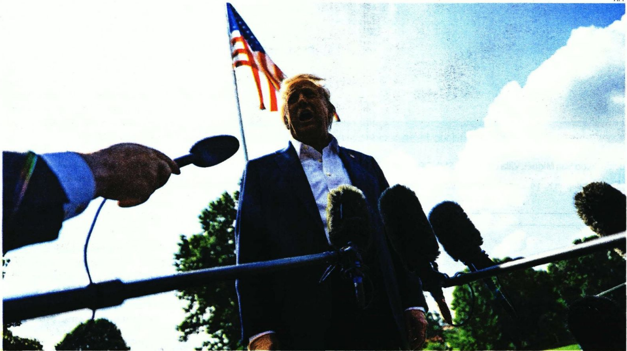
Donald Trump notificó por medio de una carta a Claudia Sheinbaum sobre los aranceles