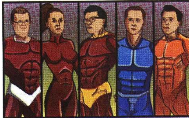
Ilustraciones: Erick Zepeda

Vencer obstáculos, conocer la realidad o, incluso, elegir las mejores fotografías son algunos de los superpoderes que los presidenciables presumen en redes sociales, en su lucha por atraer simpatizantes. / 10