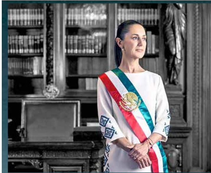
• El 1° de octubre de 2024, la doctora Claudia Sheinbaum asumió la presidencia de México.