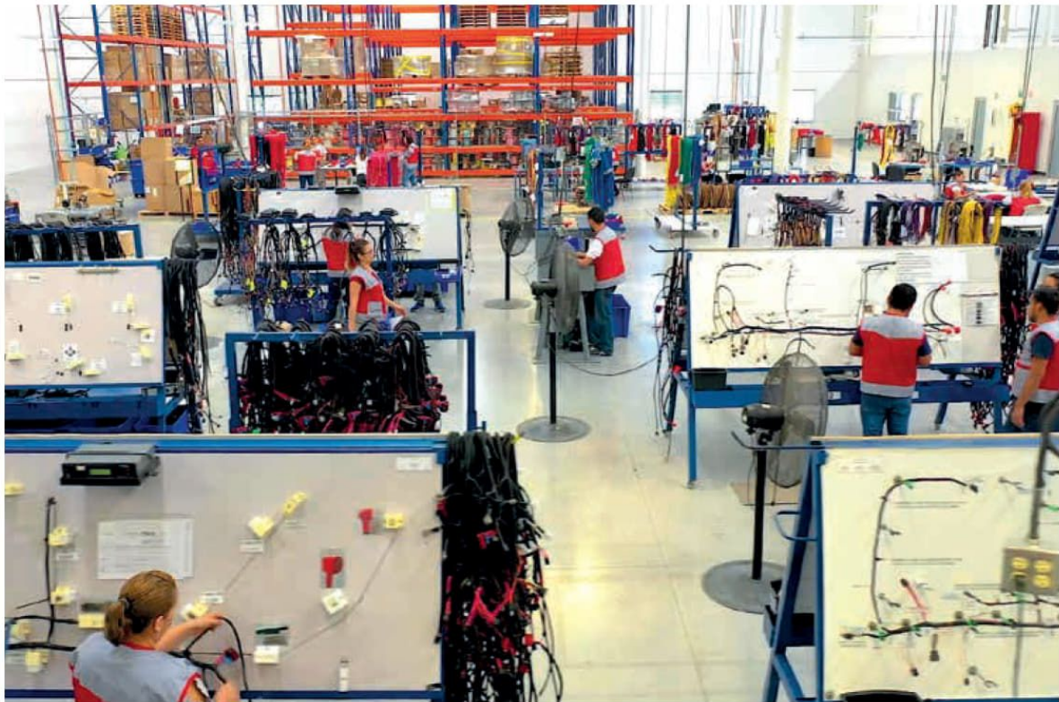
Ante la renegociación del acuerdo económico, la Coalición de Organizaciones de la Sociedad Civil por los Derechos Humanos Laborales en la Revisión del T-MEC, integrada por agrupaciones civiles y sindicatos independientes, está exigiendo “comercio justo y libre de explotación” y que en su Capítulo 23 sobre contenido laboral se prohíba claramente el trabajo forzado en maquiladoras corporativas.

Piden también adiciones al Capítulo 23 del T-MEC sobre temas laborales, entre las que destacan la inclusión de trabajadores migrantes inscritos en el sistema de visas H-2 y medidas para prevenir la violencia y el acoso laboral, conforme al Convenio 190 de la OIT.