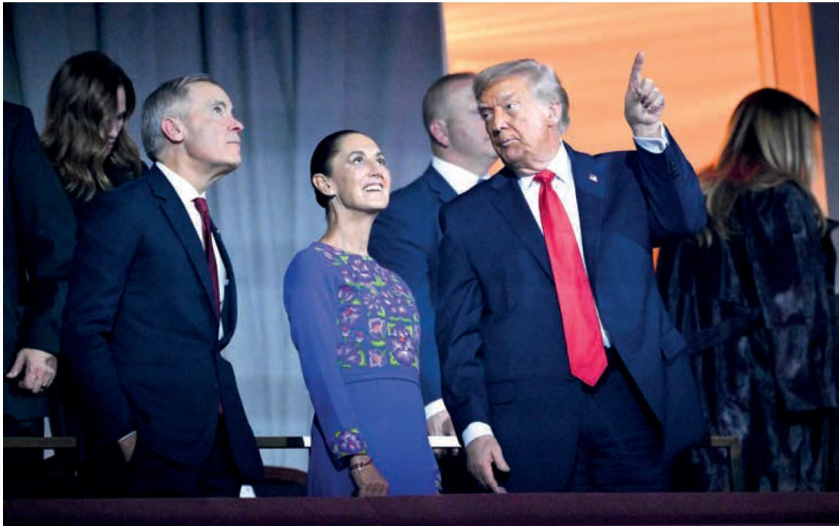
Las presiones han subido ahora que se está renegociando el T-MEC, acuerdo comercial del que depende el 85 por ciento de las exportaciones mexicanas y la importación de más de la mitad de los alimentos básicos que consumimos. Según palabras y acciones del magnate endurecerá las condiciones para que el Gobierno mexicano “se sintonice” con el fortalecimiento del bloque mercantil regional para afrontar el avance económico de China.