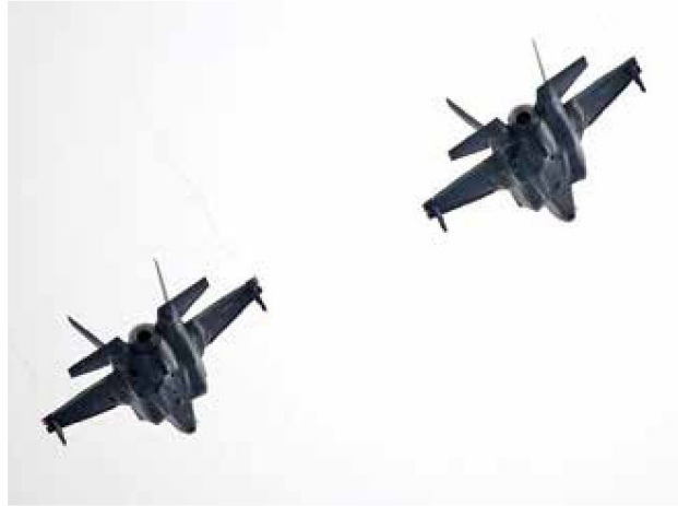
Aviones F-22 sobrevolaron la base militar de Alaska.