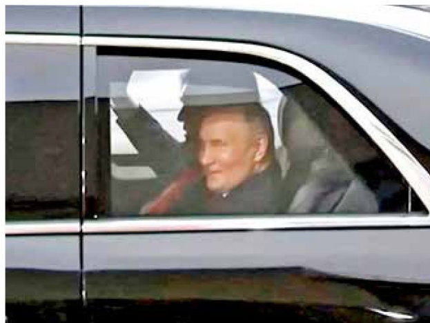
Ambos viajaron en el vehículo conocido como La Bestia .

“Van a organizar una reunión ahora entre el presidente Zelenski, el presidente Putin y yo, supongo”, subrayó.