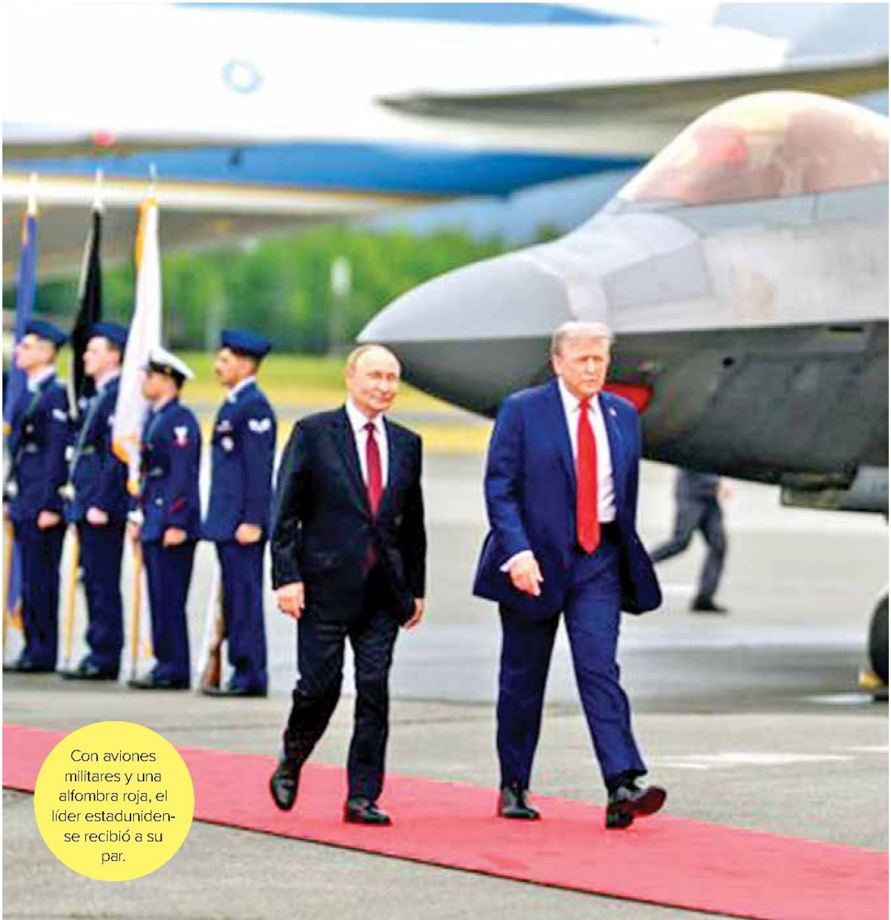
Con aviones militares y una alfombra roja, el líder estadounidense se recibió a su par.