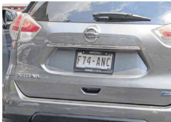
El uso del portaplaca no tiene nada de malo, simplemente con que se vea el QR, comentó un automovilista.