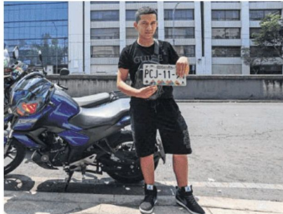
Job contó que le retiraron la placa porque la tierra ensució los números y pagó 300 pesos de infracción.