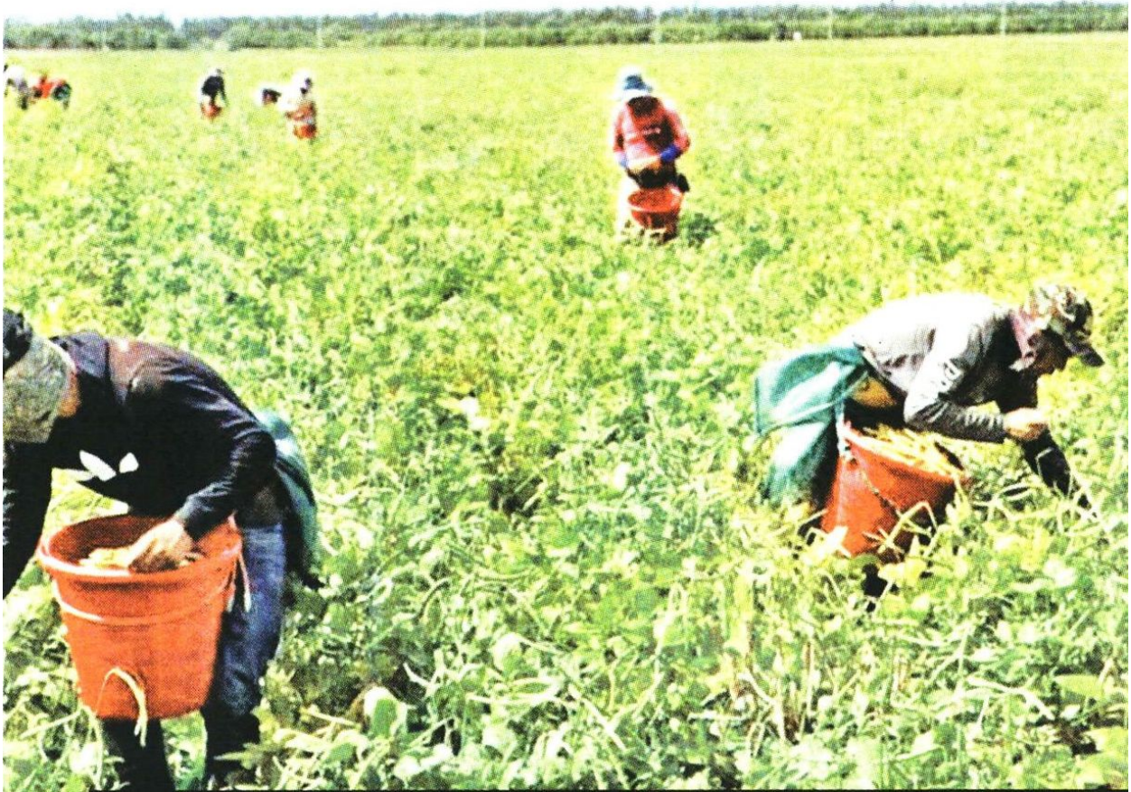
Extranjeros indocumentados trabajan en viveros y cultivos agrícolas en Florida.