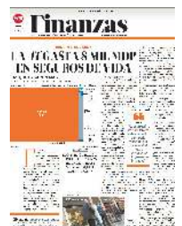
Gráfico: Rodolfo Gómez García