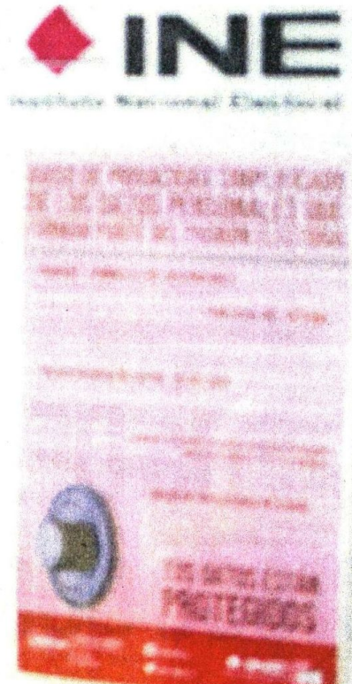
El INE brinda atención a través de módulos o a domicilio para las personas con problemas de salud, o mediante la SRE para connacionales en el extranjero.