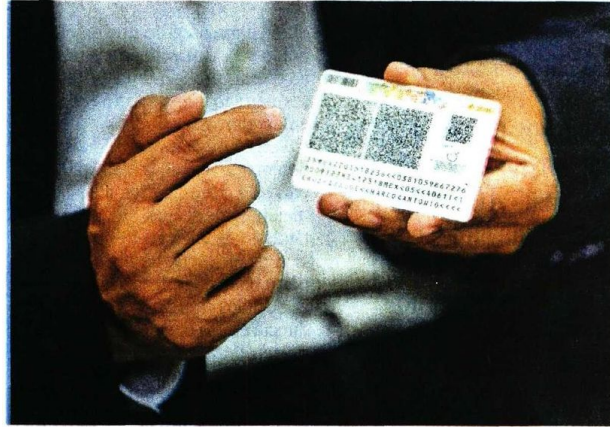
El INE no sólo genera credenciales para votar, sino un documento para identificarse, de acuerdo con el funcionario.