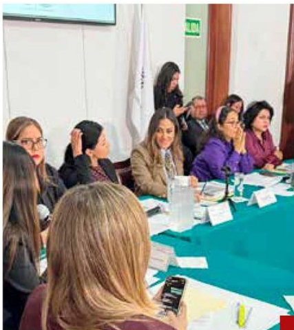
Durante la comparecencia, legisladores recibían “línea”.