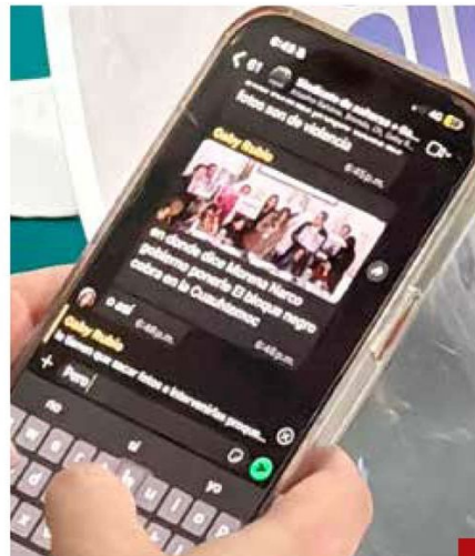
Por WhatsApp les llegaban las indicaciones.