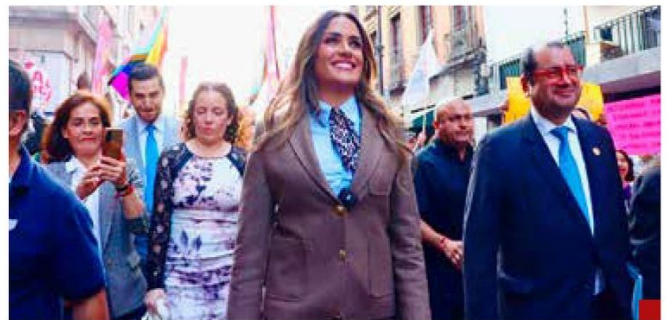
Una mujer de retos.