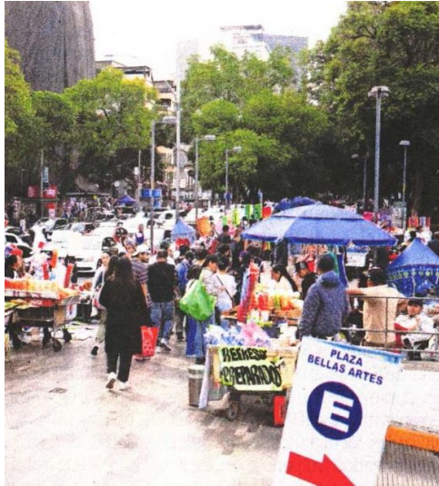
Luego del operativo, los vendedores se colocaron en los alrededores de la Alameda Central.