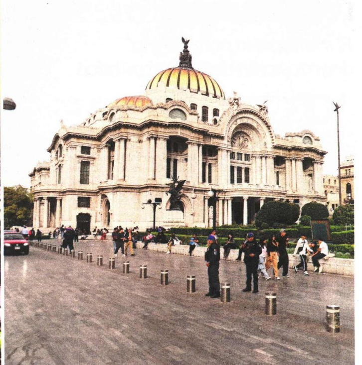
Tras la presencia policiaca, la explanada del Palacio de Bellas Artes fue despejada de comerciantes ambulantes que volvieron a ocupar ese espacio a finales de noviembre.