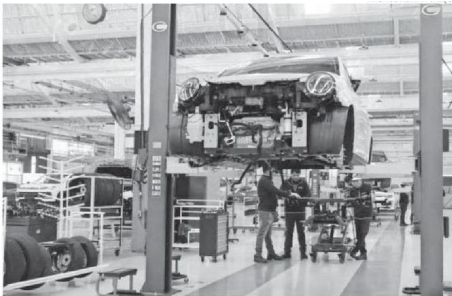
Trabajadores evalúan un auto en una planta de ensamble en Hidalgo