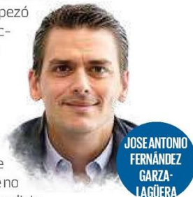
JOSE ANTONIO FERNÁNDEZ GARZA-LAGÜERA

FEMSA, QUE DIRIGE Jose Antonio Fernández Garza-Lagüera , empezó a dar los números de las afectaciones que sufrió por la ola de violencia de este domingo 22 de febrero, alcanzando a más de 200 tiendas OXXO y estaciones de servicio de FEMSA. La compañía activó protocolos, cerró unidades y se coordinó con autoridades, que no haya clientes lesionados es un alivio, aunque la cifra de incidentes confirma que las empresas ya operan con esquemas de contingencia casi permanentes. La empresa regia irá reabriendo sus unidades de manera gradual. En el fondo, lo que ocurrió a FEMSA ilustra lo que miles de negocios enfrentan día a día, y es que la inseguridad no solo altera ventas y logística, sino que obliga a que cada decisión operativa dependa del humor de factores externos que nada tienen que ver con el mercado.