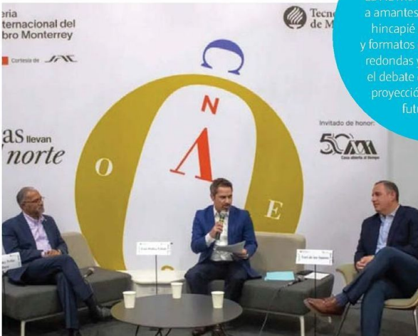
CIUDADES DEL FUTURO. Interesante documental sobre construcción sostenible.