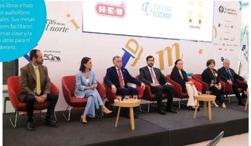
LA UAM. Invitada de honor, la casa de estudios puso el foco en temas ambientales.