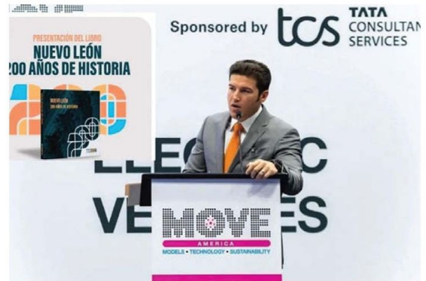
SAMUEL GARCÍA. El gobernador presentó Nuevo León, 200 años de historia .

La FIL Monterrey 2024 reunió a amantes de los libros e hizo hincapié en los audiolibros y formatos digitales. Sus mesas redondas y talleres facilitaron el debate de temas clave y la proyección de ideas para el futuro literario.