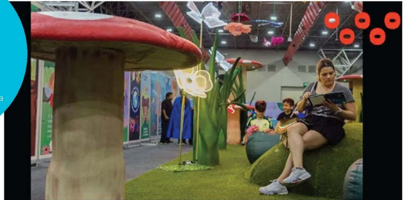
PABELLÓN DE LA NIÑEZ. Un oasis para recorrer diversos mundos mediante los libros.