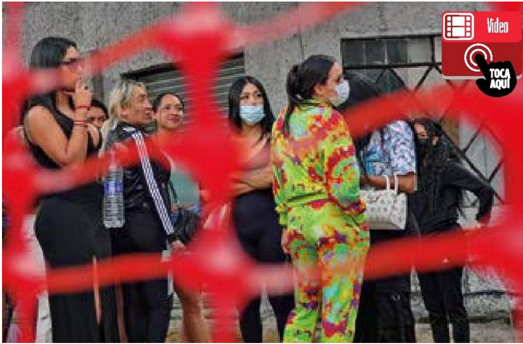
NÚMERO. De acuerdo a integrantes de la organización defensora de derechos humanos, hay 3 mil 500 trabajadoras sexuales en Tlalpan.