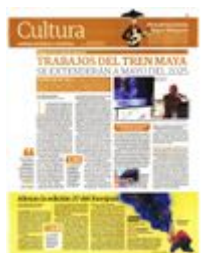
DIEGO PRIETO , director del INAH, ayer durante una conferencia en el Templo Mayor.