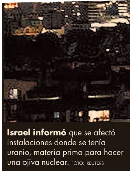
Israel informó que se afectó instalaciones donde se tenía uranio, materia prima para hacer una ojiva nuclear.