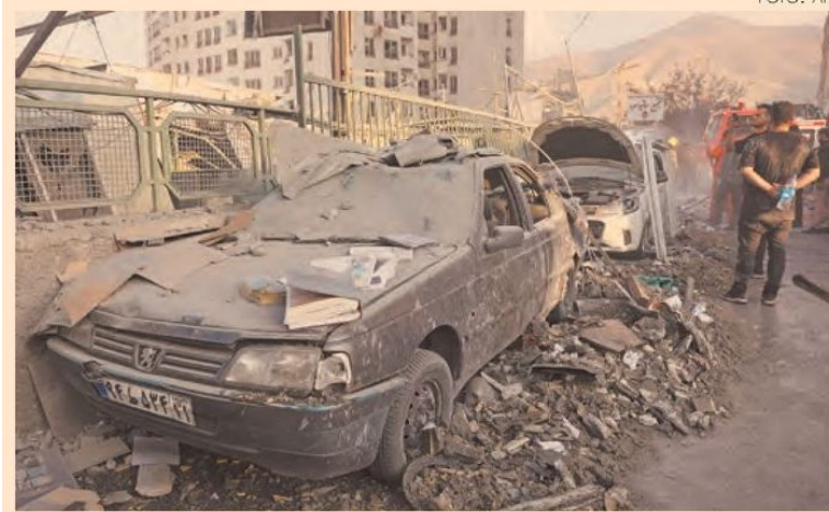
Los ataques alcanzaron a la población civil y sus propiedades.