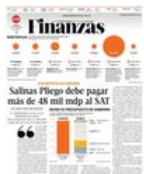
Gráfico: Rodolfo Gómez García