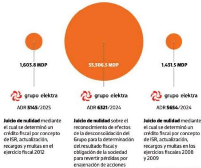
Gráfico: Rodolfo Gómez García