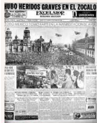
RESPALDO. Miles de personas acudieron al Zócalo a manifestar su respaldo.

El 18 de marzo de 1938, cuando el presidente Cárdenas decretó la expropiación petrolera, los trabajadores de Excélsior festejaban los 21 años de vida de El Periódico de la Vida Nacional en el Frontón México, donde, según la crónica del cumpleaños del diario, “muchos artistas desfilaron por el escenario hasta bien entrada la noche, entre ellos Pedro Vargas, el célebre tenor de la voz de oro, que, a última hora pudo dedicar a EXCELSIOR algunas de sus más bellas canciones”.