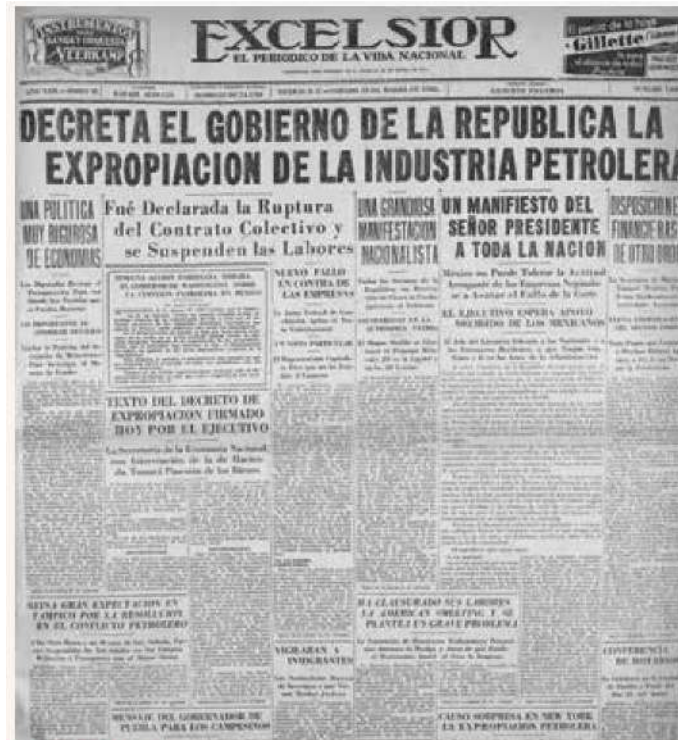
COBERTURA. La portada de Excélsior del 19 de marzo de 1938 dio cuenta del anuncio presidencial la víspera.