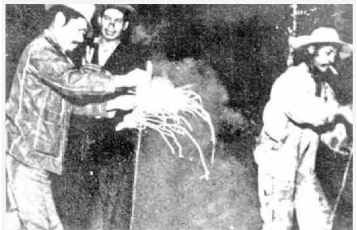
JÚBILLO. Trabajadores expresaron con la quema de cohetes su respaldo a la expropiación petrolera.