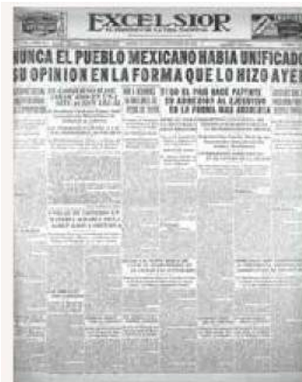
APOYO. Excélsior retrató el sentir del pueblo a la Expropiación Petrolera.