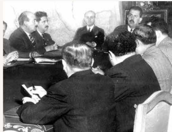
NEGOCIACIONES. El presidente Cárdenas recibió en Palacio Nacional a representantes de las empresas extranjeras.