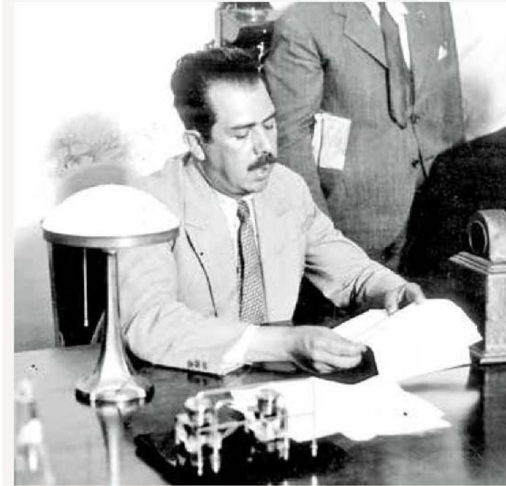
PREÁMBULO. El presidente Cárdenas da lectura a un manifiesto a la nación, la víspera de la Expropiación Petrolera.