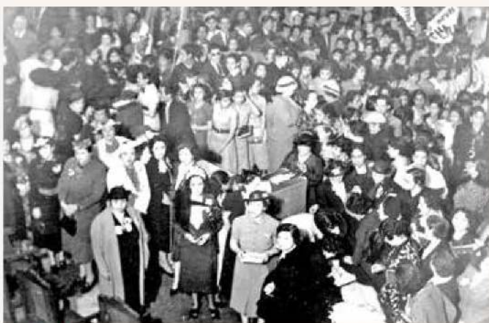
APOYO. En el Zócalo capitalino hubo muestras de respaldo a la determinación presidencial.