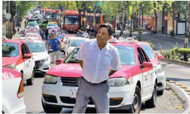
• CAOS. Buscaban llegar al Zócalo y bloquearon arterias principales.

2 Advertieron que, de no tener solución a sus demandas, volverán a manifestarse en las calles.