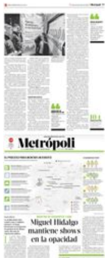
Gráfico: Rodolfo Gómez García

D El organizador y el personal de seguridad privada serán responsables de la seguridad de los espectadores en caso de emergencias, riesgo o siniestro, independientemente de la intervención de las alcaldías u otra autoridad competente