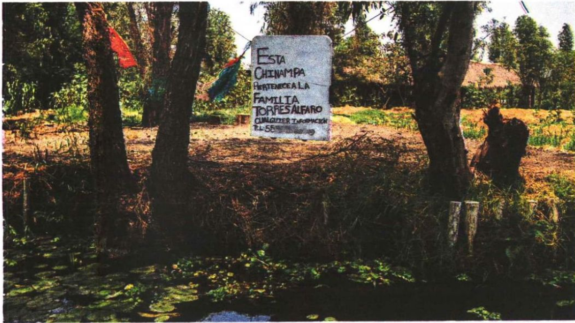
Aunque parece que están vacías, hay propietarios que defienden sus chinampas