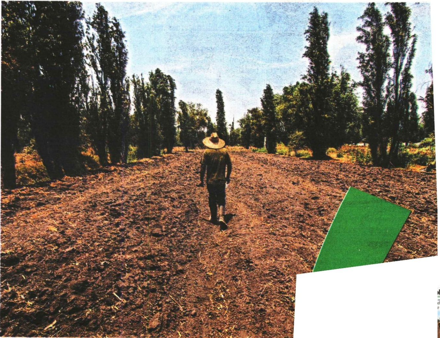
Los chinamperos padecen falta de apoyos para la siembra

DEL SISTEMA chinampero de la ciudad estaba activo hasta 2018, según la Organización de las Naciones Unidas para la Alimentación y la Agricultura