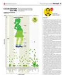
Gráfico: Jaqueline Bautista