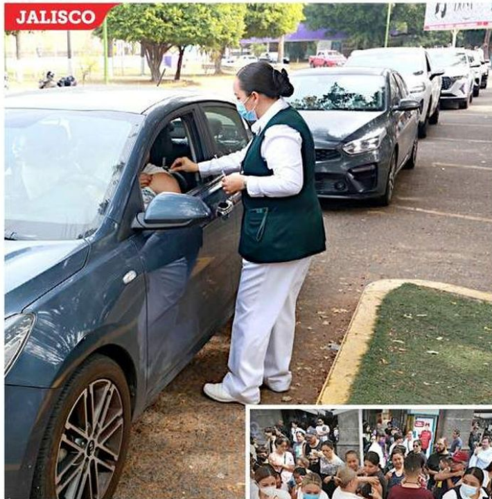
En algunos puntos de vacunación se superaron las expectativas al registrarse una alta afluencia de personas.