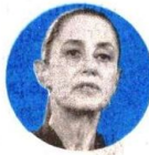
CLAUDIA SHEINBAUM Presidenta de México