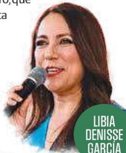
LIBIA DENISSE GARCÍA

El corredor que incluye los estados de San Luis Potosí, que gobierna Ricardo Gallardo ; Guanajuato, que encabeza Libia Denisse García , y Querétaro, que encabeza Mauricio Kuri , resulta muy costoso en términos de seguridad para los transportistas.