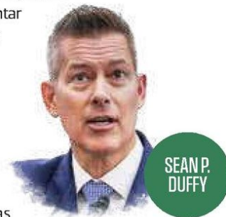
SEAN P. DUFFY

EN LOS ÚLTIMOS meses la relación aérea entre México y Estados Unidos se tensó, porque el Departamento de Transporte (DOT) acusó a nuestro país de no respetar el acuerdo bilateral de aviación firmado en 2015. Las principales quejas fueron: reducción de vuelos ( slots ) en el Aeropuerto Internacional de la CDMX (AICM), traslado de carga aérea al Aeropuerto Internacional Felipe Ángeles (AIFA) y supuestas condiciones de competencia desiguales. El anuncio dado a conocer ayer es un avance positivo en este conflicto, pero no tiene un punto final. Primero, porque se reconoce lo que se debió hacer en su momento: integrar al AIFA como parte de la oferta aeroportuaria de la CDMX, lo que amplía la capacidad de operar a aerolíneas de Estados Unidos indistintamente en cada terminal aérea. La Secretaría de Infraestructura Comunicaciones y Transportes, a cargo Jesús Esteva , no deja claro si algunas operaciones de carga podrían regresar al AICM, como tampoco cuál será la operación del grupo bilateral que dará seguimiento al cumplimiento de todos los puntos