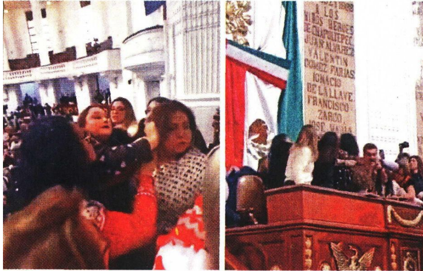
A la trifulca en la tribuna se sumaron más diputadas con jaloneos de cabello.