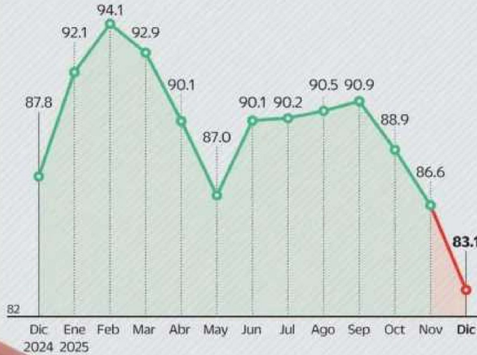
Precio promedio por barril de gasolina importada Dólares por barril