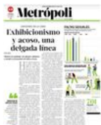
Gráfico: Jaqueline Bautista