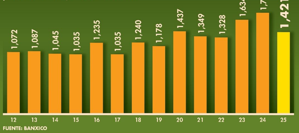
México | Exportaciones de jitomate, primer semestre | MILLONES DE DÓLARES

La cuota antidumping de 17.09% que Estados Unidos comenzó a aplicar al jitomate mexicano posiblemente genere la pérdida de aproximadamente 100,000 empleos.