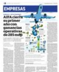
Gráfico: Lorena Martínez