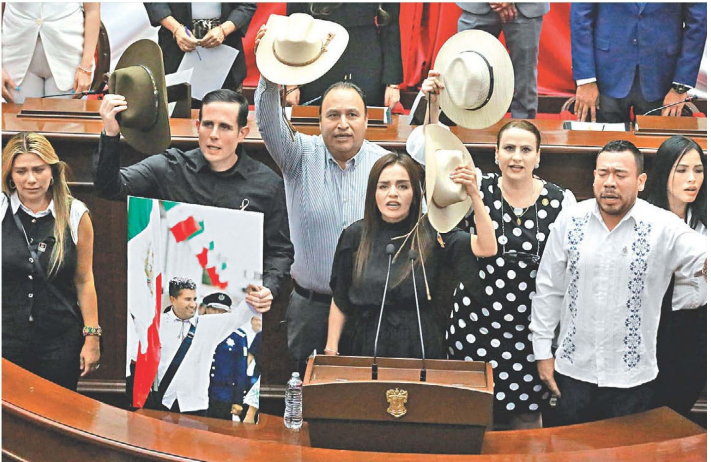
“Sus manos se fueron limpias, en todos los sentidos, jamás pactó con nadie, su lucha fue transparente”.