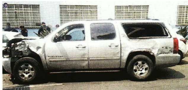
La camioneta que conducía el presunto delincuente.

“Es importante mencionar que el policía que repelió la agresión, también fue presentado ante las autoridades ministeriales para rendir su declaración, asimismo, personal de la Dirección General de Asuntos Internos ya tomó conocimiento para coadyuvar con las indagatorias”, señaló la Policía.