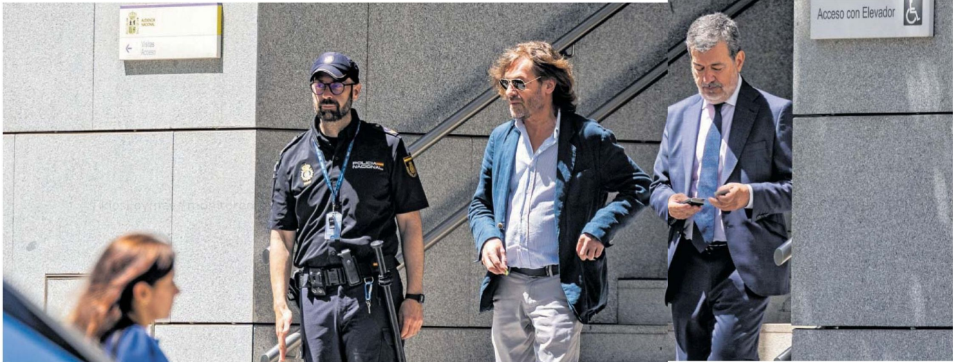
Santiago Pedraz, en el centro, salía el martes de la Audiencia Nacional. CLAUDIO ÁLVAREZ