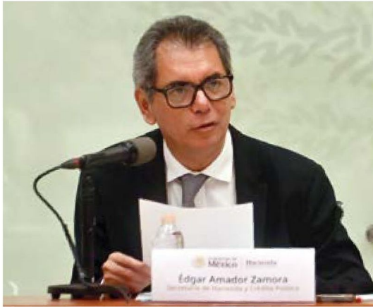
REPORTE. El secretario de Hacienda al presentar el Informe de Finanzas Públicas.