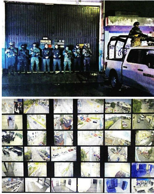
Fuerzas navales y estatales aseguraron el inmueble, donde se proyectaban imágenes de distintos puntos del Municipio.