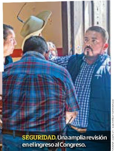
SEGURIDAD. Una amplia revisión en el ingreso al Congreso.