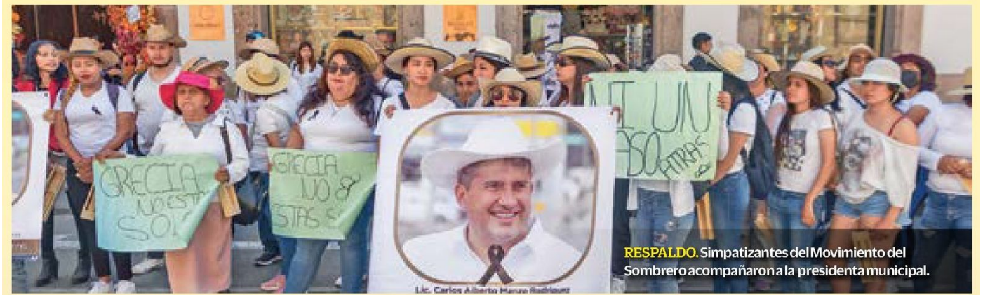
RESPALDO. Simpatizantes del Movimiento del Sombrero acompañaron a la presidenta municipal.