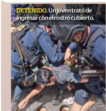
DETENIDO. Un joven trató de ingresar con el rostro cubierto.