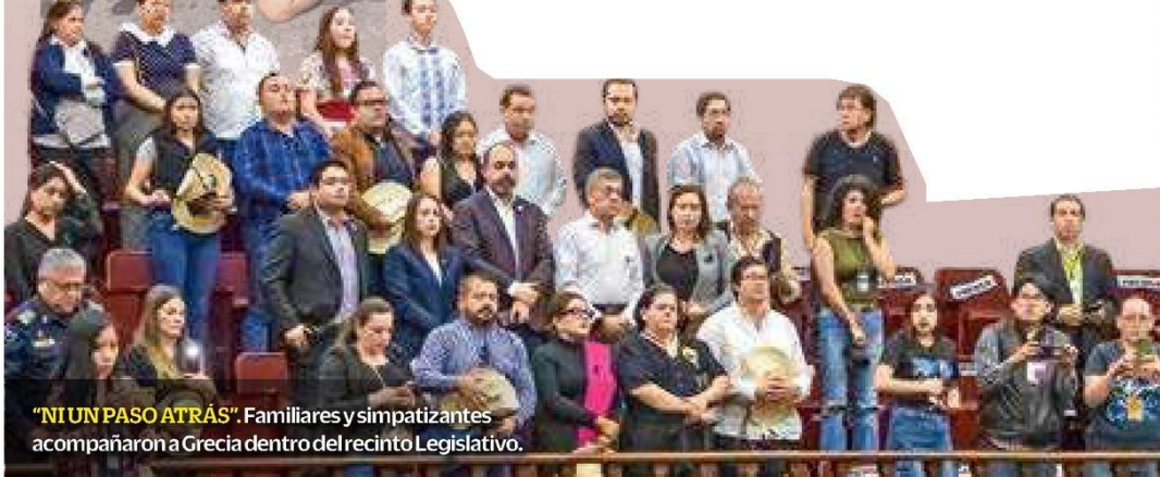
"NI UN PASO ATRÁS". Familiares y simpatizantes acompañaron a Grecia dentro del recinto Legislativo.