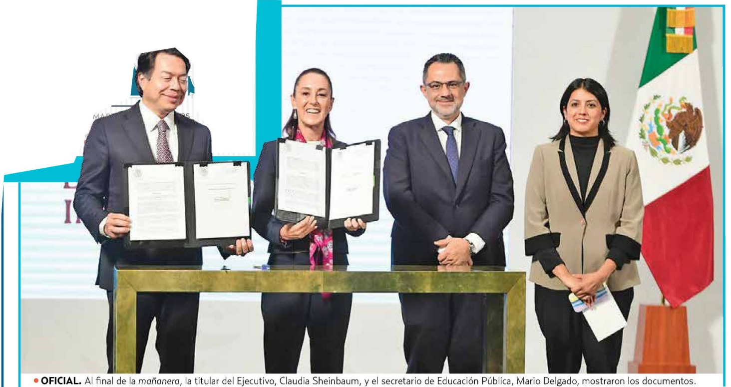
● OFICIAL. Al final de la mañanera , la titular del Ejecutivo, Claudia Sheinbaum, y el secretario de Educación Pública, Mario Delgado, mostraron los documentos.