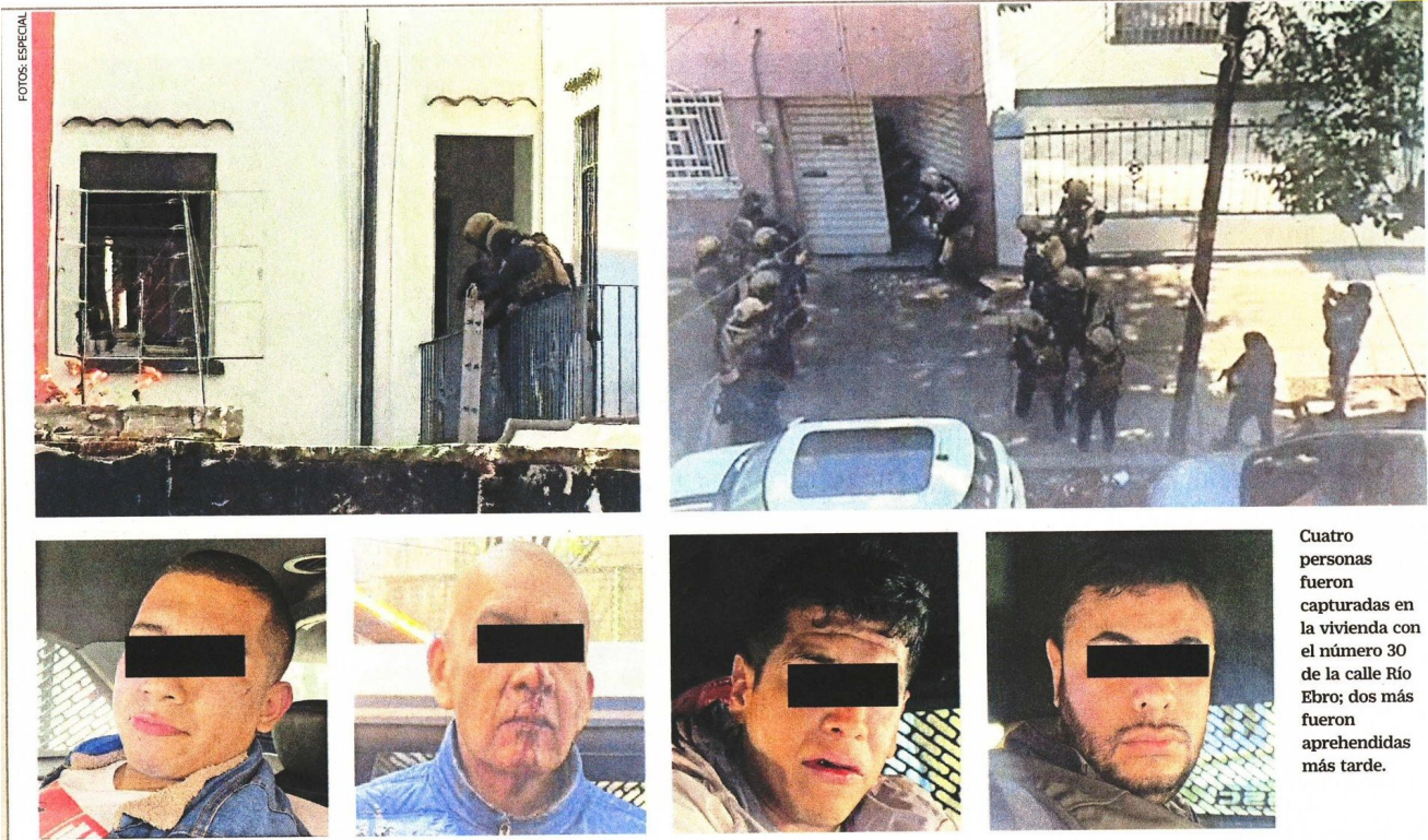
Cuatro personas fueron capturadas en la vivienda con el número 30 de la calle Río Ebro; dos más fueron aprehendidas más tarde.