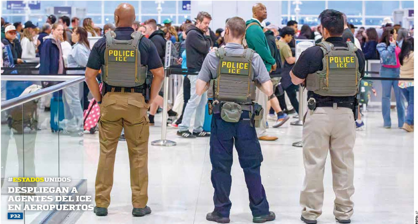
#ESTADOSUNIDOS DESPLIEGAN A AGENTES DEL ICE EN AEROPUERTOS P32