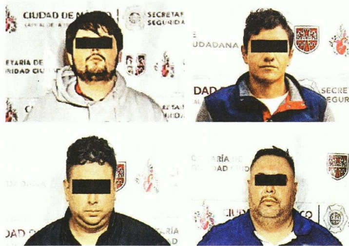
Cuatro narcos, los últimos capturados en la capital.

· FUENTE: Gobierno de CdMx · INFORMACIÓN: Saúl Hernández · GRÁFICO: Moisés Butze